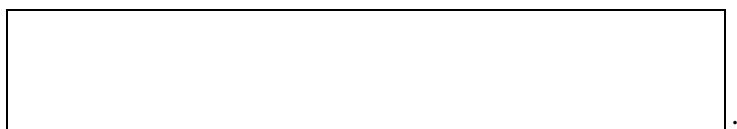
Схема границы эксплуатационной ответственности

Организация водопроводно- канализационного хозяйства Нижнетагильское муниципальное унитарное предприятие «Горэнерго-НТ» (ОГРН 1126623013461)